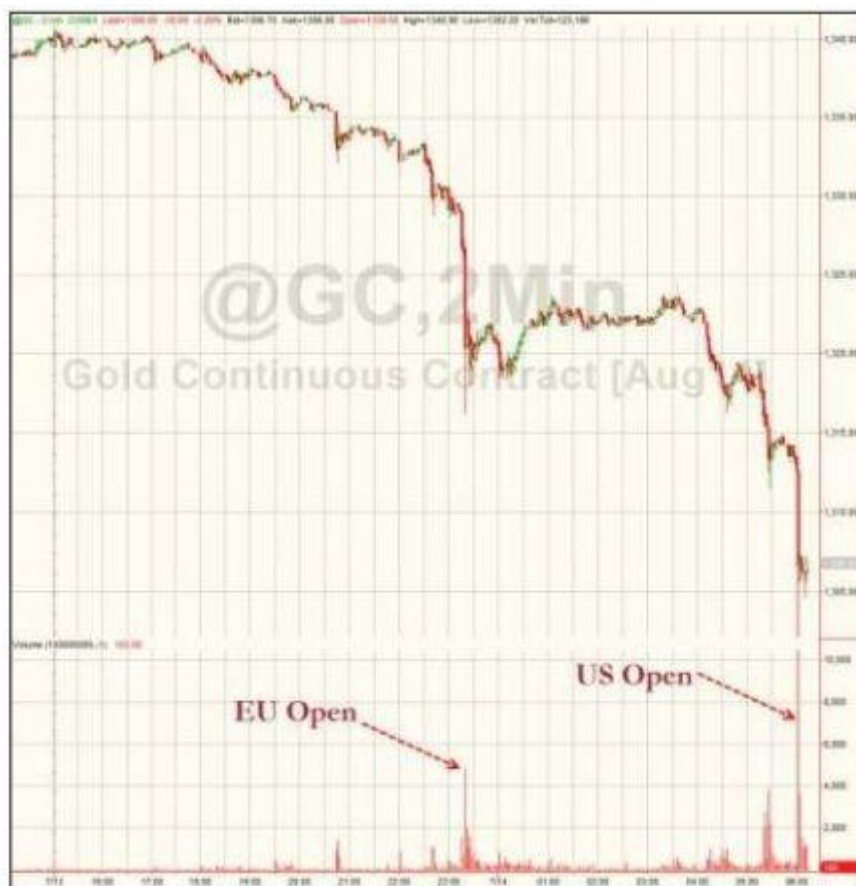
图 2: 欧洲时段和美国市场开盘时, 黄金均出现了重挫

实质上早在亚洲时段金价就因为股市上扬而大幅跳水, 时段末已经跌至 1315 美元附近, 为近两个月来最大日跌幅。周一由于葡萄牙银行业危机影响被市场吸收, 同时一些地缘政治风险, 如乌克兰和伊拉克均出现稳定迹象, 导致美/日飙升, 多数风险资产持续走强。